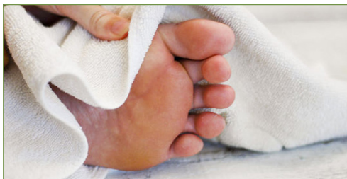
Husk å tørke føttene godt etter dusj/bad.